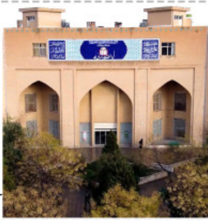
۱. دانشگاه تراز انقلاب اسلامی

تبیین را بکار ببرید، می‌توانید در دانشگاه اثرگذار باشید.» ۱ حال فرصت تبیین است؛ تبیین نقش دانشگاه. اگر دانشگاه بتواند نقش فرهنگی خود را به خوبی ایفا کند، آن وقت است که می‌تواند به نظام سیاسی نیز خط بدهد، می‌تواند برای نظام اجتماعی نیز الگو و راهنمای عمل باشد و برای نظام اقتصادی نیز قابلیت های لازم را تأمین و نیروی انسانی مورد نیاز را تربیت کند و ظرفیت انطباق نظام را با محیط افزایش دهد. اما تعریف‌مان از این نقش فرهنگی چیست؟ نقش فرهنگی دانشگاه را می‌توان در ایجاد ساختاری برای تربیت «انسانی باورمند» جلوه داد تا از این طریق، راه را بر گسترش «عرصه بی تفاوتی» نسبت به مسائل بست و بیش از این نظاره‌گر انشقاق دانشگاه و جامعه نبود؛ حال می‌توان ظرفیت انطباق میان درون و برون آنچه می‌بینیم را افزایش داد. اما آیا کار فرهنگی را می‌توان همانند مسئولین دانشگاه در ستادی برگزار کردن برنامه‌های فرهنگی دید تا همه تشکل‌ها برای برگزاری یک برنامه در زیر بیرق دانشگاه قرار بگیرند؟! بدون توجه به ساختار و محدودیت های آنان؟ حال آنجا که رهبر انقلاب در یکی از دیدارهایشان با دانشجویان با اشاره به موضوع اتحاد تشکل های دانشجویی، بیان کردند: «این اتحاد خوب است، اما نه به این معنا که همه تشکل ها از بین بروند و یک تشکل بوجود بیاید، این تجربه درستی نیست. راه درست این است که این تشکل های دانشجویی موجود، با تفاهم، حق بینی و آن چیزی که خاصیت دانشجوی است، خودشان را به یکدیگر نزدیکتر کنند، حرف حق را وسط بگذارند و جانبداری ها و مخالفت ها از استدلال و منطق ناشی شود.» ۲ البته با این تفاسیر، در حال حاضر نه تنها ایجاد فضایی برای