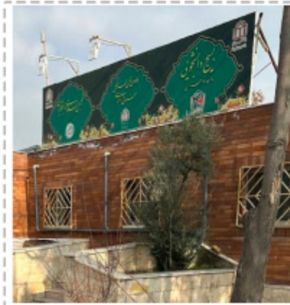
۳. فضای باز آزاداندیشی در طیف ها و تشکل ها!

دانشگاه ندارند و هیچ تشکل دانشگاهی هم دغدغه این امر را ندارد، نتیجه اش می شود بی اعتنائی به صحبت دانشجو و مدیریت پشت درهای بسته. البته از این نکته نباید غافل شد که گویا سطح دغدغه تشکل هایمان، صرفاً ربودن گوی رقابت در دعوت از میهمانان سیاسی کشوری است که البته اگر در این موضوع هم، توان پذیرفتن دیدگاه مخالف خودشان را نداشته باشند، نامه نگاری را شروع کرده و سطح مطالبه شان از مسئول می شود آنکه «شما کار خودتان را بلدید، اما دیگران نمی گذارند!» اما منشأ این نوع تفکر چیست؟ این تفکر بیانگر آن است که گاهی اوقات، افرادی که خود را به عنوان تنها صاحبان حقیقت تلقی می کنند، در مسیر تحمیل ایدئولوژی های خاص و یکسویه گام برمی دارند. به عبارتی، این نوع تفکر به جای آنکه در پی گسترش فضای فعال و پویای دانشگاه و تبادل آزاد اندیشه باشد، می کوشد تا دیدگاه خود را به دیگران القا کند و در راستای انحصار حقیقت و تک صدایی پیش برود. گویی قرار نیست حقایق حال حاضر جامعه را از نظر ابعاد سیاسی، اجتماعی و فرهنگی بپذیرد. با این اوصاف، نه تنها جایی برای گفتگو و گفتمان آزاد باقی نمی ماند، بلکه با تحمیل بی چون و چرای این نوع تفکر، فضای دانشگاهی از تنوع فکری و ظرفیت های نقد و تحلیل تهی می شود و در نهایت، این نوع تفکر، نتیجه ای جز عدم توانایی در پذیرش دیدگاه مخالف را نخواهد داشت. حال با این سطح دغدغه طیف ها و تشکل های دانشجویی، آیا می توان انتظار پیگیری مشکلات آموزشی، علمی و فرهنگی دانشگاه را از آنها داشت؟ امیدواریم که ترویج گفتمان آزاد اندیشی و البته عمل به آن، ترویج هم اندیشی صحیح با پشتوانه اندیشه و