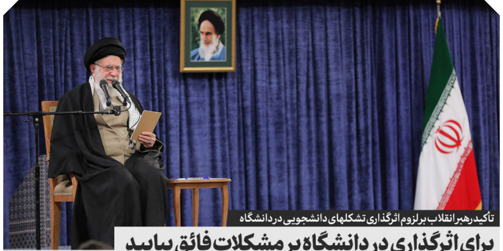
تأکید رهبر انقلاب بر لزوم اثرگذاری تشکلهای دانشجویی در دانشگاه