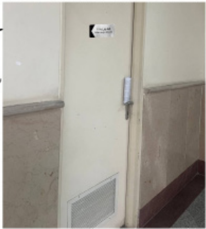
۲. مدیریت پشت درهای بسته!

بیان جانبداری‌ها و مخالفت‌ها مطابق با استدلال و منطق در دانشگاه‌مان جایی ندارد، بلکه سیاست خطرناک انحصارطلبی دانشگاه معطوف به یک طیف محدود و خاص، آنچنان بروز و ظهور پیدا کرده که تجلی آن را در تخصیص بودجه های فرهنگی نیز می‌توان مشاهده کرد! اما بدانیم که اینگونه تفکر حمایت انحصارطلبانه، دانشگاه را که باید محل تلاقی ذهن های مستقل و خلاق و جایگاه کثرت اندیشه ها و تحولات فکری باشد، به کانونی بسته و مکانی برای سلطه افکار محدود و تک سویه مبدل می‌سازد. مسئولین بزرگوار، دانشگاه در نگاه کلان به ساختارش تعریف نمی‌شود، بلکه به عاملیت آن، به من خلاق آن تعریف می‌شود. تا کجا قرار است طبق ساختار تک ساحتی دانشگاه ریاست کنید و در را به روی فضای آزاد سیاسی و فرهنگی دانشگاه ببندید؟ توجه کنید، آنچه که امروز از دانشگاه‌مان ساخته‌اید، چیزی جز تسلط انفعال در سایه فضای بن بست آزاداندیشی و تحول گرایی نیست. رهبر انقلاب در دیداری با دانشجویان با اشاره به لزوم طی کردن نردبان تعالی توسط دانشگاه بیان کردند: «طرفدار دانشگاهی هستیم که اعتلاطلب، فعال و از لحاظ علمی و فکری پرنشاط باشد. من هرگز دانشگاه و دانشگاهی را به محافظه کاری و اکتفا به آنچه که امروز از فکر و فرهنگ و معرفت در دست دارند، توصیه نمی‌کنم. معتقدم محافظه کاری و اکتفای به آنچه داریم و نداشتن همت و بلندپروازی در همه زمینه‌های فکر و فرهنگ، قتلگاه انقلاب است.» ۳ لیکن در حال حاضر به عنوان جامعه دانشگاهی به آنجا رسیدیم که در دوره‌های آرمان و مصلحت، مطابق با الزامات مصلحت‌گرایانه و منافع کوتاه مدت، قدم در مسیر «مصلحت» گذاشته و آرمان‌خواهی را به یادها سپردیم! آقایان! ما نقد داریم اما امید اصلاح را هنوز از دست نداده‌ایم. میدان تحول گرایی را برای